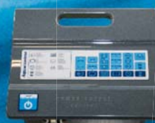
Confortable: AquaControl-Box y sistema de control remoto