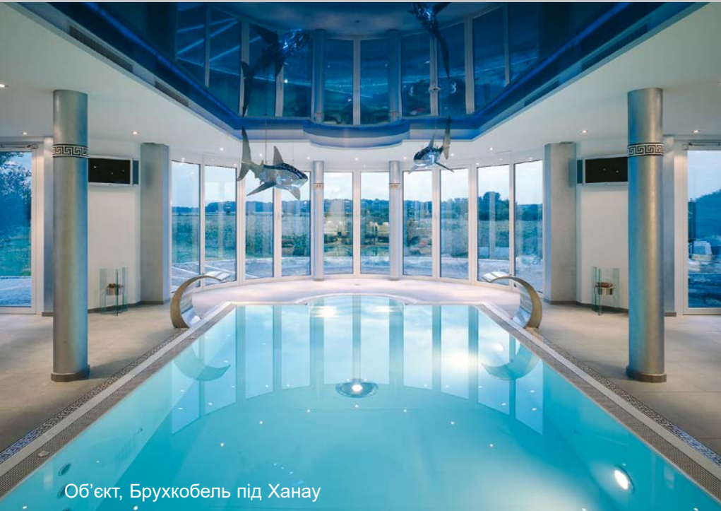
Об'єкт, Брухобель під Ханану