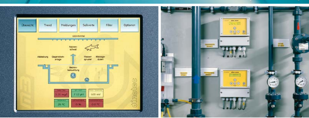
Отель Rocco Forte Villa Kennedy, Франкфурт на Майні.